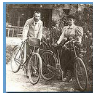
Figura 4. Foto de Marie y Pierre ante la casa de Sceaux, de los padres de Pierre, con las bicicletas que obtuvieron como regalo de boda y con las que hicieron el viaje de novios.

Estos descubrimientos desencadenaron una revolución